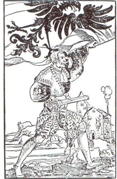
Oppenheim im Februar 2015

An die Mitglieder des Oppenheimer Geschichtsvereins